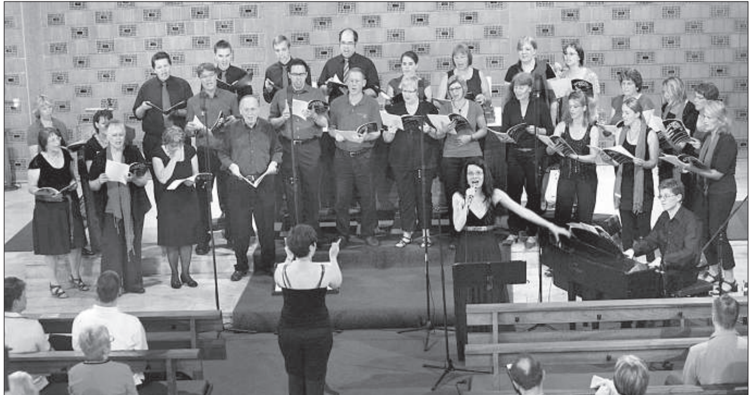
Mit zwei Konzerten in der katholischen Kirche in Weiler feierte der Chor Sotto Voce sein zehnjähriges Bestehen.