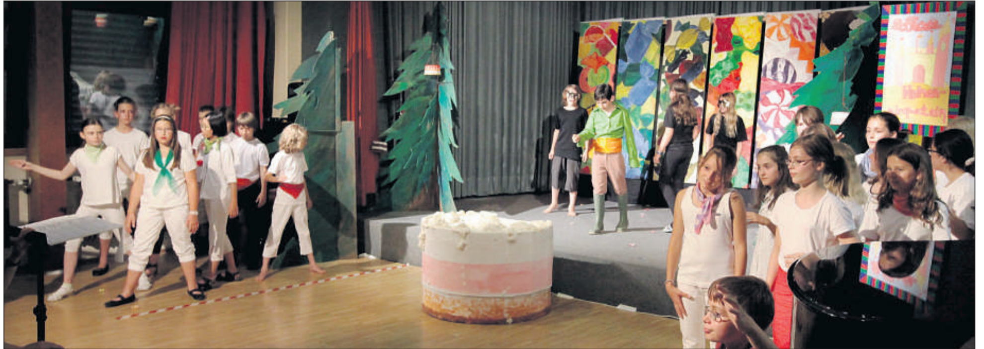
Der Prinz aus Krokantien wird von den Schülern, die zusammen das Böse Brösel darstellen, karamellisiert – und zwar mit Trüffelpralinen. Der Chor singt dazu das Trüffelduftlied.