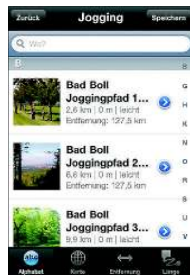
Die Routen kann man sich alphabetisch oder nach Länge anzeigen lassen