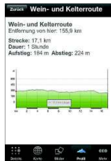
Praktisch: Das Höhenprofil zeigt an, wie stark es auf der Strecke bergauf geht