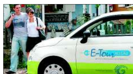
Ein Fiat 500 unter Strom