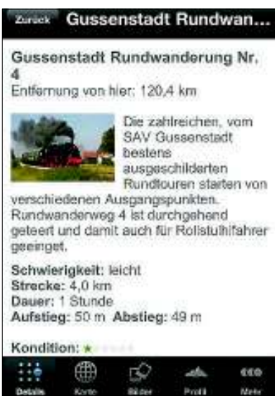
Zu jeder Tour gehört eine kurze Wegbeschreibung mit den wichtigsten Infos