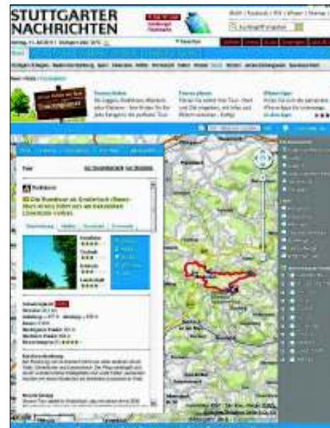
Unser Tourenplaner im Internet

Nicht nur für Bergfreunde ist der Gipffinder ein schönes Feature der „Wandern Stuttgart“-App. Hält man das iPhone Richtung Horizont, werden die Berge im Umkreis von bis zu 150 Kilometern angezeigt – und zwar mit Höhenangabe.