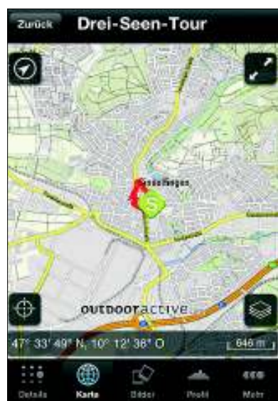
Die Tour wird auf einer Karte angezeigt – sie lässt sich leicht größer zoomen

Weitere Informationen zu den Apps unter: www.stuttgarter-nachrichten.de/tourenplaner